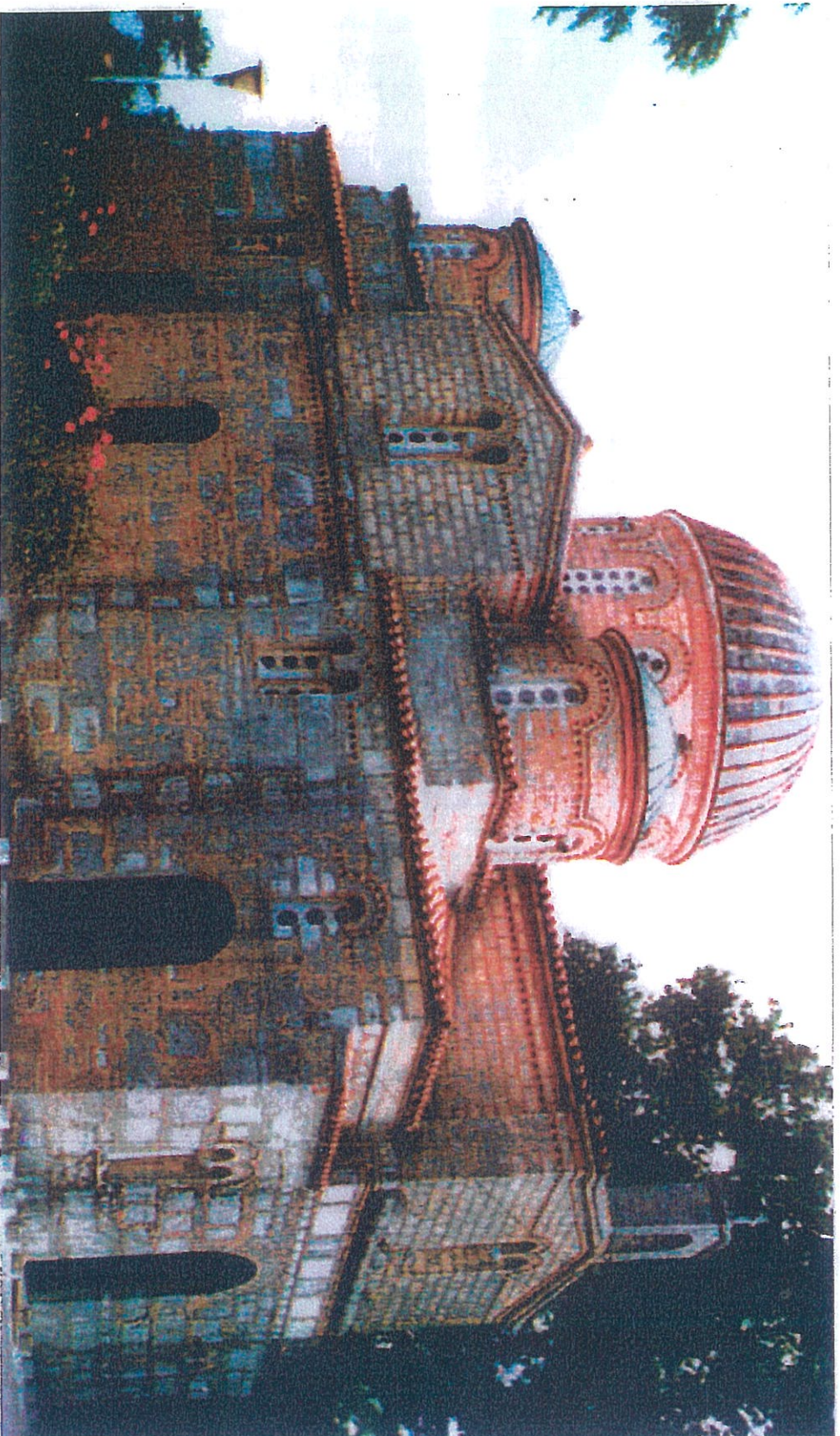
10 ος αιώνας

Ο Ιερός Ναός κοιμήσεως της Θεοτόκου στην Πλάταιά Επισκοπή Τεγέας Αρκαδίας, Η ανακαίνιση έγινε από τον μεγάλο αρχιτέκτονα Ερνέστο Τοϊνλερ και η αγιογράφηση από τον αγιογράφο Αθηνναγόρα Δοτεριάδη με επιμέλεια του Ακαδημαϊκού Α. Ορλάνδου. Η ανακαίνιση του Ναού έγινε το 1884 – 1888 από τον Τεχνατικό Σύνδεσμο.